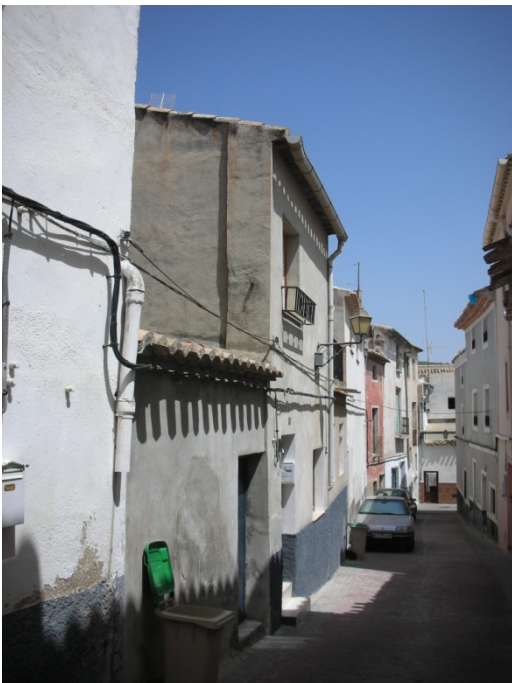
CALLE PLANCHAS Nº 10