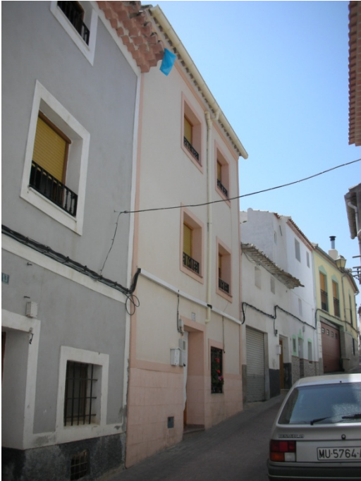
CALLE PLANCHAS Nº 16