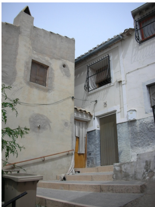
CALLE OLIVERICAS Nº 21