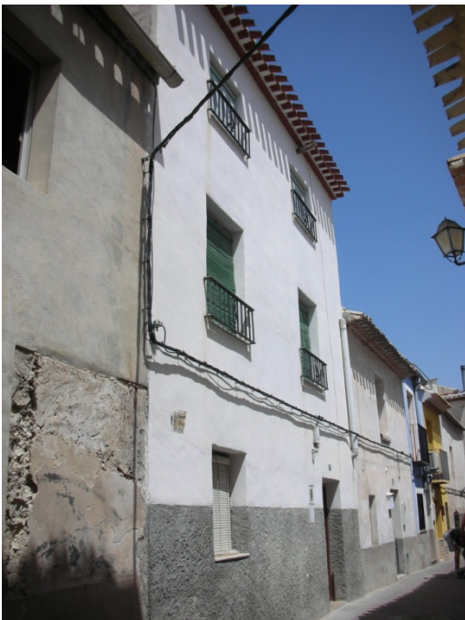
CALLE PLANCHAS Nº 44

OBSERVACIONES: MISMO EDIFICIO C/ SEGUNDA TRAVIESA Nº28