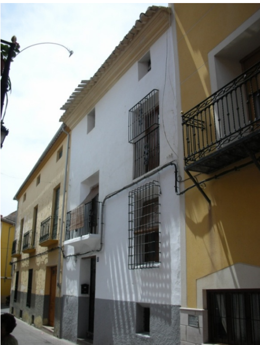
CALLE ALFONSO ZAMORA Nº 3

INTERES: NORMAL GRADO DE PROTECCION: 3 ESTADO: BUENO ELEMENTOS DE INTERES: