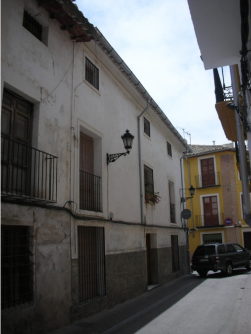
CALLE ALFONSO ZAMORA Nº 2

INTERES: NORMAL GRADO DE PROTECCION: 3 ESTADO: REGULAR ELEMENTOS DE INTERES: